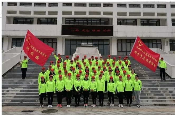
武汉马拉松志愿者