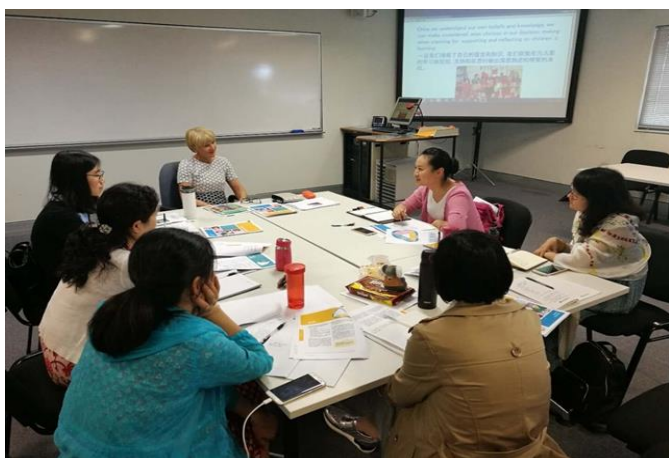
我校 6 名中教师与澳大利亚昆士兰科技大学教师交流

2. 对外培训，文化交流互促进。我校与澳大利亚昆士兰科技大学教育学院、挪威东南大学学院教育签订了校际学术交流合作协议，每年互派师生实习培训，推动我校国际交流与合作，打造具有国际视野、国际意识和国际交流能力的师资队伍，提升中职以上教师的学术水平和教学科研能力，培养一批具有较强教学改革和教育科研能力的学科带头人。2017 年 10 月，挪威中南大学组织 11 名学前教育专业的学员来我校进修，学员参与湖北省实验幼儿园的教育活动培训、参加了湖北幼专的学术交流活动与联欢活动。在这项交流中，双方就学前教育理念进行了碰撞、教育技能进行了交流、增长了学术见识、深化了两国友谊。2017 年 11 月，我校首批 6 名教师赴澳大利亚昆士兰科技大学进行为期 21 天的短期培训。