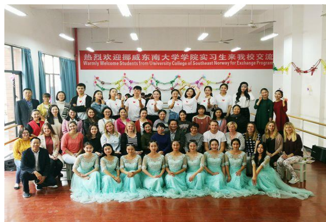
挪威中南大学 11 名师生来我校交流