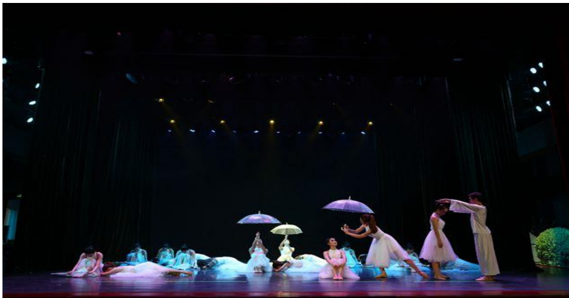
（获省赛一等奖作品“七彩的眼”）

2017 年 10 月 28 日，江夏区第十二届业余文艺创作节目“百花奖”比赛中，我校舞蹈系选送的原创作品《七彩的眼》获二等奖，作品《度》获三等奖；音乐系选送的小合唱《我需要你的》获得三等奖。