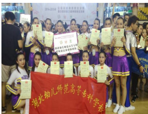
“暴走萝莉”，全国第二名

加大普通话教学力度，保证每周 2 学时教学与训练，在普通话测试前期，每个班派专人进行辅导，确保训练到位，通过测试。多年来，我校学生普通话一次性通过率（二甲）在 83%以上，二次性通过率达 95%