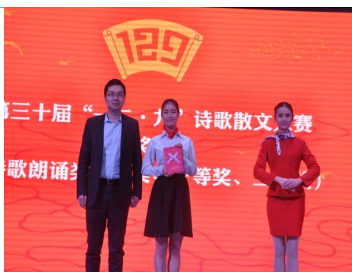
朗诵比赛，省高校第一