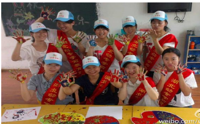
在幼儿园开展模块活动的喜悦

二是加强了学前教育专业的硬软件建设。首先是加大投入，改善了专业发展条件。投资学前教育实训中心教玩具建设、模拟室建设，改善了学前教育专业的教学、教研条件。其次，修订完善人才培养方案和质量评价体系。根据《幼儿园教师专业标准》、《教师教育课程标准（试行）》和《3-6岁儿童学习与发展指南》等文件，按照“幼儿为本、师德为先、能力为重、终身学习”的理念，从基本素养、专业知识、职业技能三个方面确定了学前教育专业人才培养规格，构建了具有自身特色的课程体系（建立了由职业道德与心理健康、幼教理论、知识领域、教学设计与教育技能四大课程模块搭建而成的专业课程体系；确立了以健康、语言、社会、科学、艺术“五大领域”的知识为核心的课程结构；完善了从保育、教育、家园共育三个方面设置的以能力培养为中心的实践课程体系；构建了以实用为目的的选修课程五大模块），建立了“课程学习、技能训练、汇报表演、教育实习、园长考核、就业评价”的质量监管与评价体系。再次，加强了专业教学团队建设，引进了年富力强的高学历教师，聘请了具有丰富实践经验的一线教师，形成了学历、年龄、职称结构、专业结构日趋合理的师资队伍。