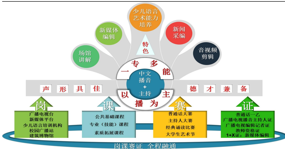
人才培养模式结构图